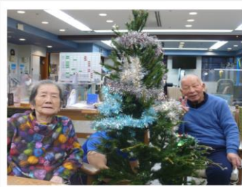
▼ 1階玄関風除室にて