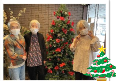
▲ 2階 デイルームにて デイサービスの皆様が 飾り付けをしてくださいました♪