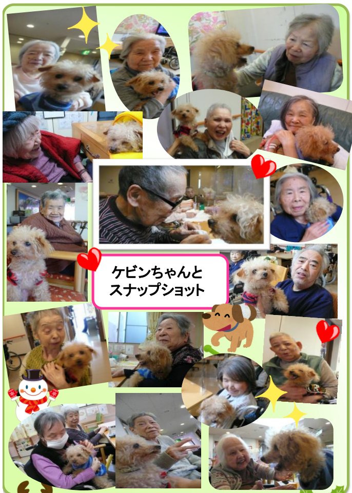
ケビンちゃんと スナップショット