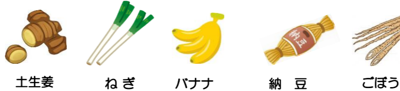
土生姜 ねぎ バナナ 納豆 ごぼう

<答え>土生姜・ねぎ・ごぼう バナナと納豆も栄養価が高いので毎日食べたいですね。