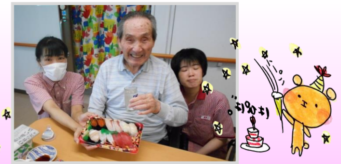
バースデイのお祝いはお部屋の担当が行っています。