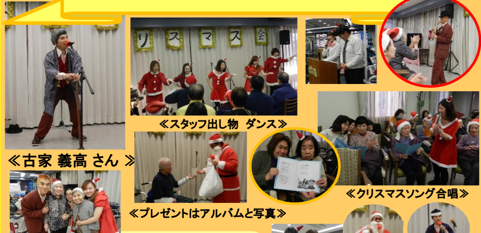
《スタッフ出し物 ダンス》