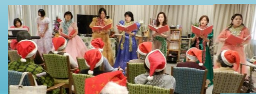
☆17日(日) コーラスボランティア MCA 様

ミレニアムで活動されている ボランティアの皆様や 講師の先生方とクリスマスの 歌やダンスで 楽しい時間を 過ごしました♪