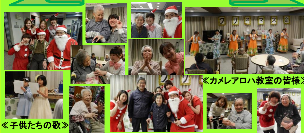
《カメリアロハ教室の皆様》