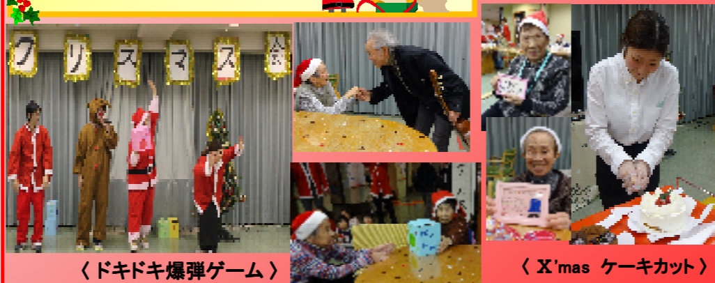
〈ドキドキ爆弾ゲーム〉

今年1年の思い出の写真を集めたスライドショーを 見ながら、クリスマスケーキをいただきました。 家族・スタッフからは、メッセージカードをもらい 記念撮影をし、盛りだくさんの 楽しいクリスマス会でした。